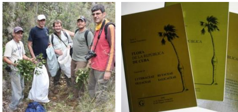
Kuba & Karibik